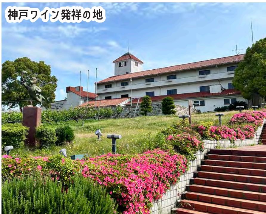
神戸ワイン発祥の地