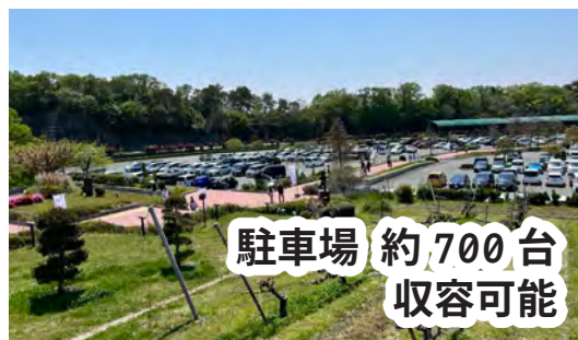
駐車場 約700台 収容可能